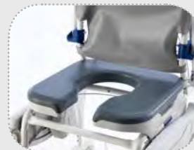
Siedziska i oparcia