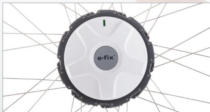
Kompaktowy, lekki, pełen mocy: moduł napędowy e-fix