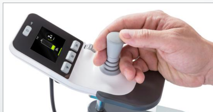
Informacyjny kolorowy wyświetlacz i przyjazne dla użytkownika elementy sterujące