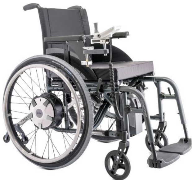
e-fix E36: mocne koła jezdne o większej mocy (opcja)