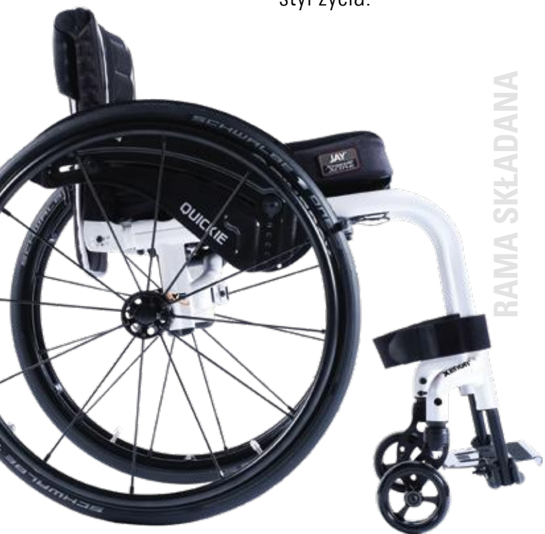
XENON 2 od 8,8 kg

Naszym celem jest zapewnienie maksymalnej niezależności oraz innowacyjnych, niezawodnych rozwiązań, które pomogą naszym użytkownikom prowadzić wymarzony styl życia.