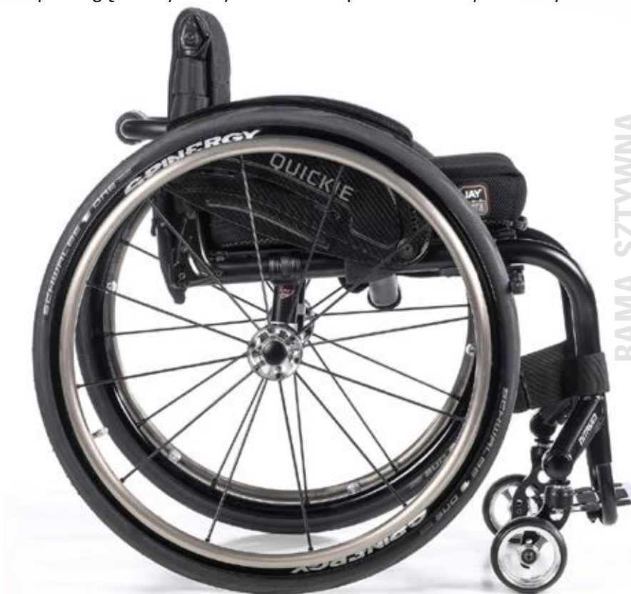
NITRUM od 7,2 kg