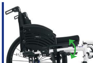
REGULOWANY KĄT SIEDZISKA: 0° - 10°

V500 Active zapewnia idealne połączenie stabilności i mobilności, które wspiera użytkowników w ich codziennych czynnościach.