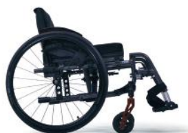
C86 Szary karbon

Dostępna jest możliwość wyboru spośród wielu odcieni, co pozwoli Ci spersonalizować swój wózek inwalidzki i naprawdę podkreślić swoją wyjątkowość.