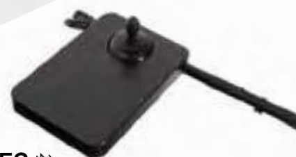
Kompaktowy z wyświetlaczem LED